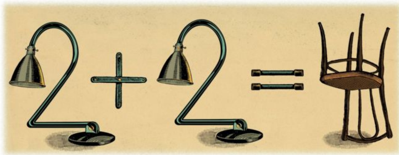
ILUSTRACIÓN: RAÚL ARIAS